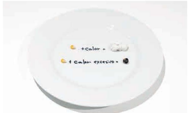
LA COMIDA DEL ARTISTA (PUERTA AMPLIA, MESA ESTRECHA). FOTO: ARIEL RIVEIRO