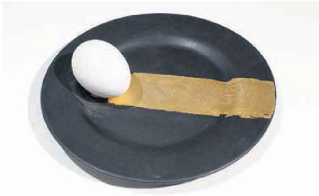
LA COMIDA DEL ARTISTA (PUERTA AMPLIA, MESA ESTRECHA). FOTO: ARIEL RIVEIRO