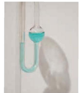
TODO EN MARCHA (ÍNDICE DEL MOVIMIENTO GENERAL DE LOS SERES Y LAS COSAS).